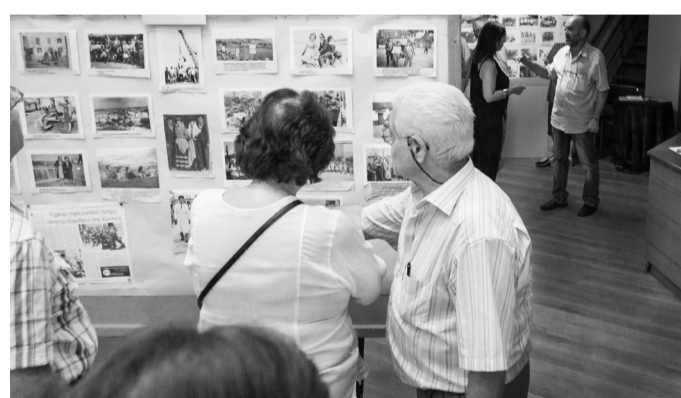
Στιγμιότυπο από την έκθεση φωτογραφίας, με θέμα η παλιά Αξιούπολη