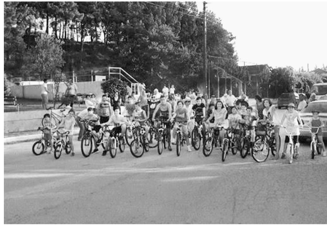
Στιγμιότυπο από την εκκίνηση δίπλα από τον λόφο του χωριού.

Η πρώτη από τις φετινές καλοκαιρινές εκδηλώσεις στο Αξιοχώρι, με την επωνυμία «Α Μ Υ Δ Ο Ν Ι Α 2016», οργανωμένες από τον τοπικό Πολιτιστικό Σύλλογο «Α Μ Υ Δ Ω Ν» ήταν η «Ημέρα ποδηλασίας», την Κυριακή 10 Ιουλίου. Όταν σε ένα μικρό χωριό των 195 κατοίκων, μικρών και μεγάλων, συμμετέχουν 55 κάθε ηλικίας στην εκδήλωση, τότε σίγουρα αυτή δε μπορεί παρά να θεωρείται επιτυχημένη. Η εκκίνηση έγινε από το γήπεδο καλαθοσφαίρας Αξιοχωριού με διαδρομή τον κεντρικό δρόμο του χωριού μέχρι την κεντρική πλατεία Άσπρου και επιστροφή. Δεν υπήρχε διαγωνισμός κατάταξης και σε όλους επιδόθηκαν πανέμορφα αναμνηστικά διπλώματα συμμετοχής. Ακολούθησε διασκέδαση στο χώρο του γηπέδου με ζωντανή μουσική από τους